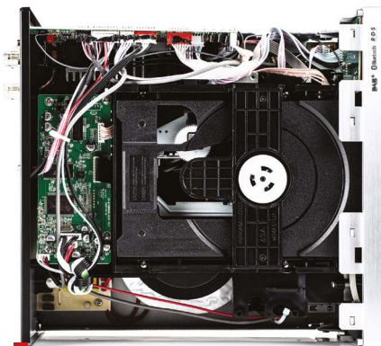
Napęd płyt pochodzi od Asatecha. To typowy czytnik ROM.

elastycznego drutu do rozwieszenia w kształt litery T. Uznałem, że tak właśnie postąpi większość potencjalnych użytkowników, którzy nie mają profesjonalnej anteny na zewnątrz budynku. W pierwszym podejściu miażdżącą przewagę uzyskał DAB. Było mniej, a właściwie to brak szumów, a dźwięk odbierałem jako bardziej gładki. Drugie podejście poprzedziło starannejsze zamontowanie anteny. Ta z pozoru niewielka zmiana znacząco wpłynęła na