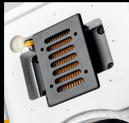
Wysokotonowy AMT zamocowano w dość niekonwencjonalny sposób.

Niskie i średnie tony odtwarza 6,5-calowa (165 mm) jednostka z aluminiową membraną o płaskiej nakładce przeciwpływowej i sztywnym zawieszeniu. Zastosowano duży układ