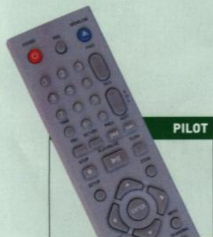
Tworzywa dobrej jakości, klawisze rozmieszczone ergonomicznie.