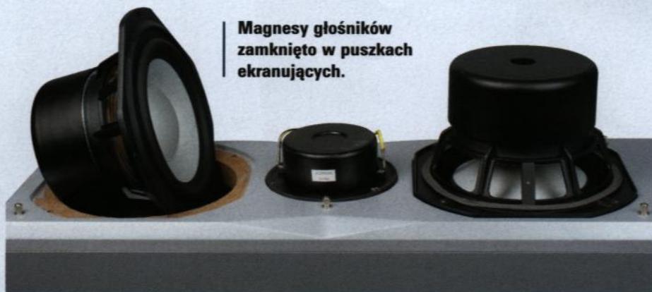
Magnesy głośników zamknięto w puszkach ekranujących.