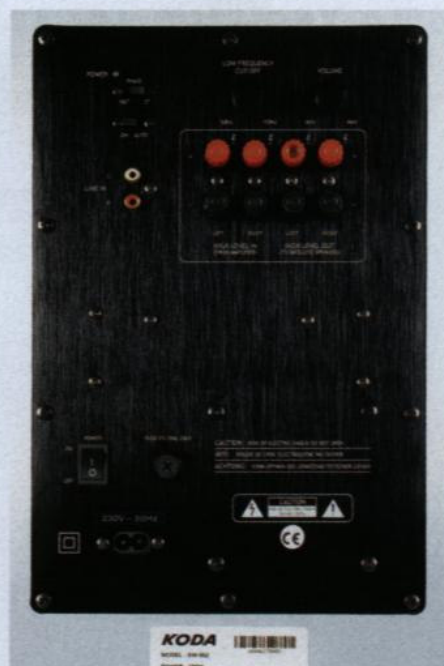
Gniazda w kolumnach akceptują dowolny rodzaj wtyków. W SL-600F możliwy jest bi-wiring.

A brzmienie? Dynamiczne, przejrzyste i efektowne. Kiedy trzeba przyłożyć, Koda się nie pieści, tylko karmi kolumny kaloryczną porcją watów. Wysoka moc sprawia, że dźwięk jest bardzo dobrze kontrolowany, a impulsy wygasają w porę. Wysokie tony są czystutkie. Tutaj konstruktorzy naprawdę się przyłożyli. Niektóre efekty potrafią wywołać gęsią skórę. Ale nawet abstrahując od kina i emocji, jakich potrafią dostarczyć śmigające nad głową kule, zauważyłem, że góra ma audiofilski charakter. Otwarty, błyszczący, może lekko rozjaśniony, ale przez to również efektowny. Najważniejsze, że nie nosi śladów zapiaszczenia i nie jest przezjaskrawiona.