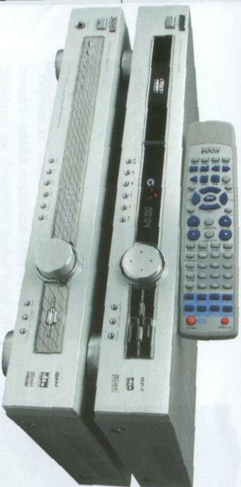
Panele czołowe AV-6330

i DVD-630A zrobiono z aluminium – w tym zakresie ceny to wydarzenie. Urządzenia sprzedawane są razem, dołączany jest do nich jeden pilot.