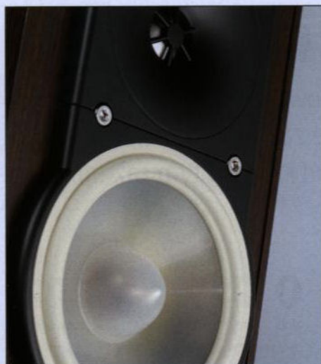
Bardzo nietypowa membrana głośnika średniotonowego i jeszcze dziwniejsze, jasne zawieszenie

Jeśli preferujemy brzmienie rytmiczne, z dobrze zdefiniowanym dołem, to bas Paradigmów uznamy za wyraźny atut. Jest krótki, zwarty, obdarzony dużym wykopem wskutek podbicia górnego podzakresu. W stosunku do Magnatów wyraźnie brakuje mu oddechu poniżej 50 Hz (skutek dużej czułości – kolumny są bardzo głośne – i małej średnicy membran), zaś w porównaniu do Cantonów jest zdecydowanie mniej liniowy. Uzyskany kompromis (brak najniższych rejestrów) jest jednak zdecydowanie satysfakcjonujący. Podkoloro-